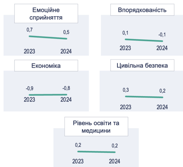
Рис. 1. Оцінка складових ІМБ: динаміка 2023 до 2024 рр.

Також у звіті, присвяченому результатам дослідження (Rating Lab, 2025), ми розглянули відмінності оцінок місцевого благополуччя за наступними ознаками: тип населеного пункту, вік, дохід; побудували рейтинг областей України за показниками індексу, за кожним критерієм-складником індексу. З'ясувалося, що тренди, характерні для вимірювання 2023 року, не втратили актуальності і в 2024: значення Індексу місцевого благополуччя в обласних центрах найбільше (0,4), у містах – помітно нижче (-0,2), а в селах – найнижче (-0,3); оцінки місцевого благополуччя знижуються з віком; оцінка місцевого благополуччя позитивно корелює з фінансовим становищем людини. Цього року до трійки регіонів з найвищим значення Індексу увійшли м. Київ (0,7), Харківська (0,4) та Львівська (0,3) області (у 2023 році до трійки увійшли м. Київ, Львівська та Івано-Франківська області). Натомість трійку регіонів з найнижчим місцевим благополуччям очолили Херсонська (-1,1), Запорізька (-0,6) і (-0,4) Сумська області (нижні сходинки рейтингу не зазнали змін після заміру в 2023 році).